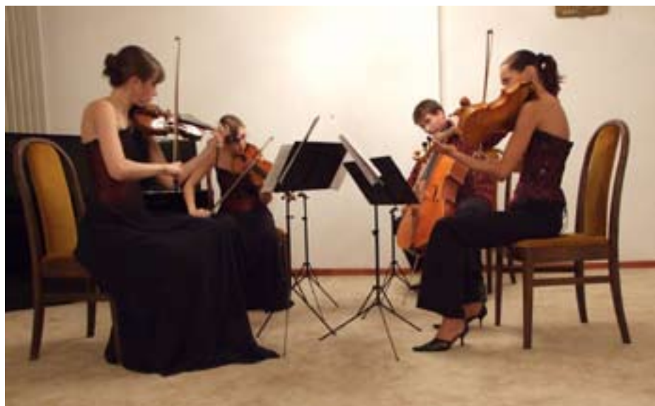
4. 10. 2007 – Quartetto di gioia.