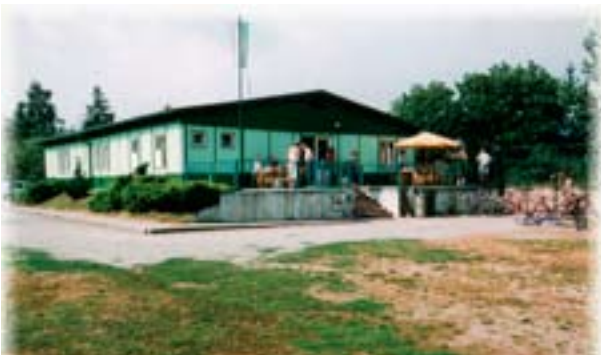
Budova SK Rájec-Jestřebí, kde jsou umístěny herny stolního tenisu, společenské místnosti a sociální zařízení

Zápasy v roce 2008 od 26. a 27. ledna budou zveřejněny ve zpravodaji našeho města. Přejeme našim hráčům mnoho sportovních úspěchů a trošku štěstí, protože to ke každému sportu patří.