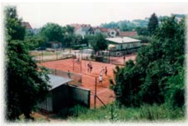
Sportovní areál SK Rájec-Jestřebí na Rybníčku v městské části Jestřebí