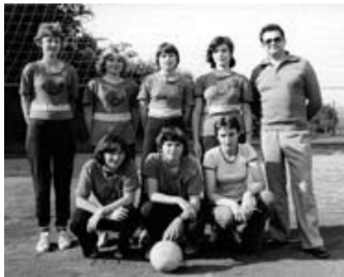
Krajský přebor dorostenek 1978