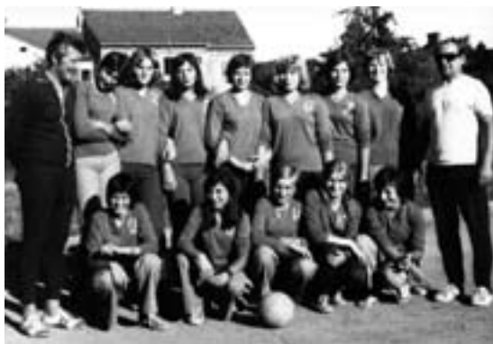
Okresní přebor žákyň 1976