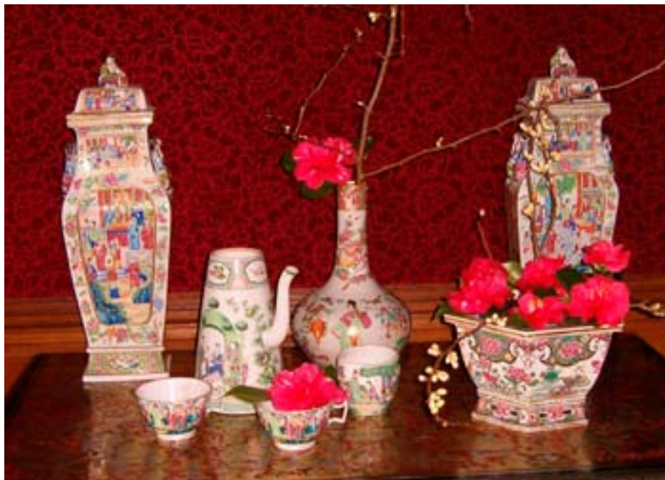
Kamélie na zámku.

Na titulní straně: Předjaří v zámeckém parku.