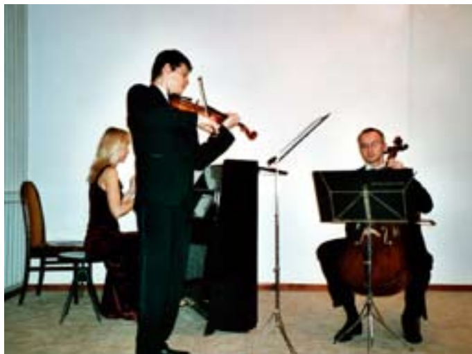
5. 1. 2007 obřadní síň – Moravské klavírní trio. Novoroční koncert.