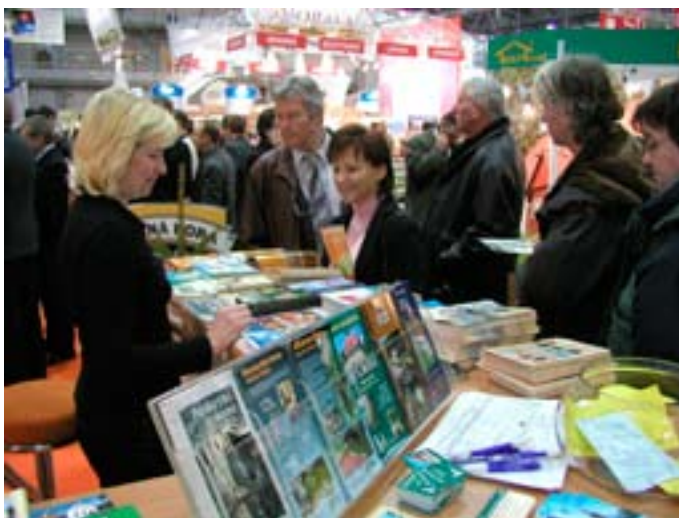
11.–14. 1. 2007 Brno. Veletřh cestovního ruchu REGIONTOUR