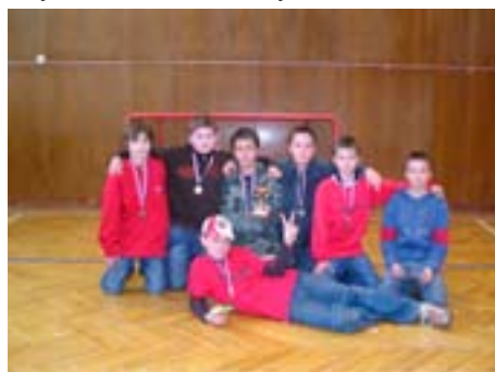
bronzové družstvo „Orli“ Rájec-Jestřebí

Dne 13.1. 2007 uspořádal Dům dětí a mládeže Blansko – OBLÁZEK již tradiční florbalový turnaj žáků, kterého se zúčastnila i dvě družstva z Rájce-Jestřebí. V prostorách tělocvičen ZŠ Samova se hráči z Rájce utkali s družstvy Blanska, Letovic, Vyškova a Brna. Oba